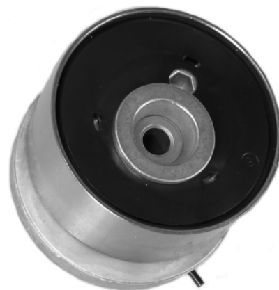
Fig. 2 Rodillo con diseño nuevo